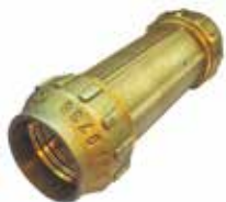
TM Platealbue 048