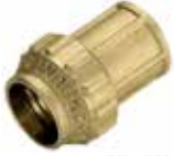
TM Tippunion 015