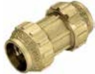
TM Union 010